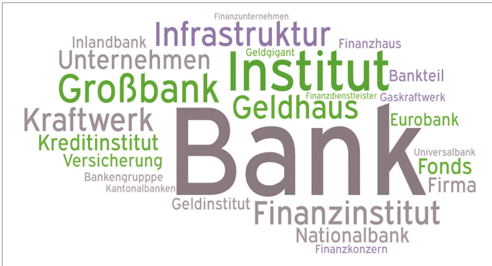
Abb. 2: Wortwolke zu statistisch signifikant häufigen Kookkurrenzen (häufig miteinander vorkommenden Wörtern) zu systemrelevant (Ergebnis der Analyse der ersten 200 häufigsten Kookkurrenzen) 4

eingestuft“ oder „systemrelevante/r/s X“, kreisen dabei auffällig im Themenbereich „Wirtschaft“ und spiegeln damit klar die auf den Finanzsektor fokussierte Betrachtungsweise rund um die Zeit der Finanzkrise wider (vgl. Abb. 2).