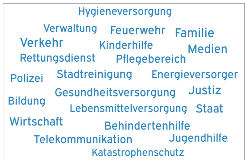
Abb. 3: Wortwolke zu derzeit häufig genannten Bereichen, die als systemrelevant gelten oder als systemrelevant thematisiert werden (das Ergebnis basiert auf einer stichprobenartigen Untersuchung aktueller Pressemitteilungen, von Beiträgen auf Foren und Blogs sowie Internet-recherchen)

schrieben wurde und viele verschiedene Lebens- und Gesellschaftsbereiche umfasst. Es werden dabei auch Sektoren und Bereiche mit dem Siegel systemrelevant benannt, die vormals weniger im Fokus der Betrachtung waren: Von der Stadtreinigung bis hin zu Personen, die in den Supermärkten an den Kassen sitzen, und auch der Familienverbund. Daneben ist die Beobachtung, dass z. B. in Pflege oder Lebensmittelhandel insbesondere Frauen ihren Dienst tun, ebenfalls Teil der Diskussion. Und der Aushandlungsprozess oder auch Ausdeutungsprozess um systemrelevant scheint auch noch nicht zu Ende und ist in der gegenwärtigen Situation wohl als dynamischer Prozess zu verstehen.