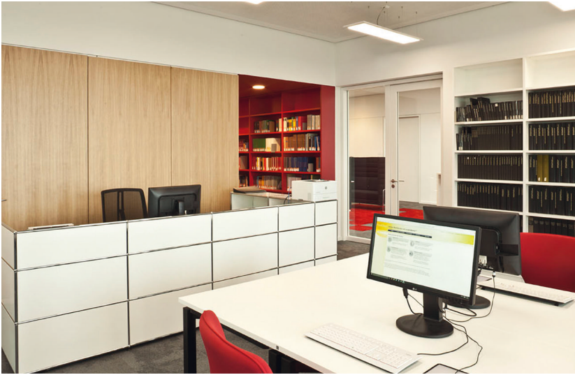
Abb 1: Lesesaal MARCHIVUM

Maßstäben beurteilen lasse. [...] Die zahlreichen persönlichen Schreiben an bekannte Protagonisten des Regimes unterstrichen dieses Streben nach individueller Anerkennung und Unterstützung, auf die man im ‚wohlgeordneten Hitlerstaat‘ ein Recht zu haben glaubte“ (Föllmer 2013, S. 39 f.).