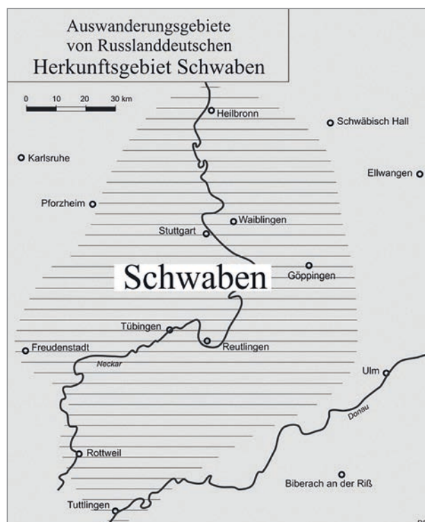
Abb. 6: Das Herkunftsgebiet der schwäbischen Siedler

Trotz vieler Gemeinsamkeiten zwischen der russlanddeutschen und der binnendeutschen schwäbischen Mundart (vgl. Tab. 1) ist es oft schwierig für die Ein-