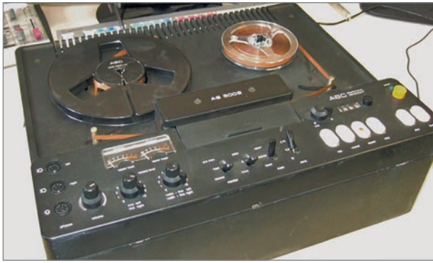
Abb. 3: Der Typ des Aufnahmegeräts, das für die Sprachaufnahmen des russlanddeutschen Dialektkorpus verwendet wurde