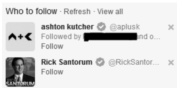
Abbildung 1: Followerempfehlungen

(1) Die Followerempfehlungen betreffen nicht direkt Inhalte (Tweets), sondern vielmehr die Produzenten der Inhalte. Twitter schlägt seinen Nutzern vor, bestimmten Accounts zu folgen (s. Abbildung 1).