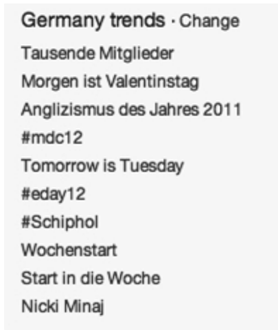
Abbildung 2: Trending Topics Deutschland 13.02.2012, Quelle: twitter.com.

Diese Top-Ten-Liste ist in einzelne Länder- bzw. Städtelisten (z. B. "Trending Topics in Deutschland/München") oder für das ganze „Twitteruniversum“ („weltweit“) unterteilbar. Zudem gibt es die Möglichkeit, individuell generierte Trendlisten erzeugen zu lassen („Tailored Trends“), deren Berechnung auf Grundlage der Followeres und des Ortes erfolgt (blog.twitter.com, 12.06.2012). Insofern bietet Twitter hier bereits Filtermöglichkeiten für die Auswahl gezielter Themenlisten. Die genauen Kriterien für die Berechnung und Komposition der Trending Topics werden von Twitter nicht genannt; ein Umstand, der immer wieder Grund zu Spekulationen um etwaige Einflussnahmen durch das Unternehmen Twitter auf die Themen-Agenda der Microblogging-Plattform gibt (s. Abschnitt 4). In Tweets lässt sich ein relativ hoher Anteil an Metakommunikation zu den Trending Topics ausmachen. Dies kann als ein Indikator dafür gewertet werden, dass Rezeptions- und Produktionsverhalten der Nutzer zu einem nicht unerheblichen Maß von den Themenvorschlägen beeinflusst sind. Durch die Auswahl von zehn aktuellen „Trendthemen“ findet eine Selektion durch den Algorithmus von Twitter statt, die für alle Nutzer gleiche Ergebnisse bringt. Daher lässt sich diese als globale Distribution bezeichnen. Die Verteilung der individuell generierten „Tailored Trends“ hingegen ist als personalisierte Distribution zu verstehen.