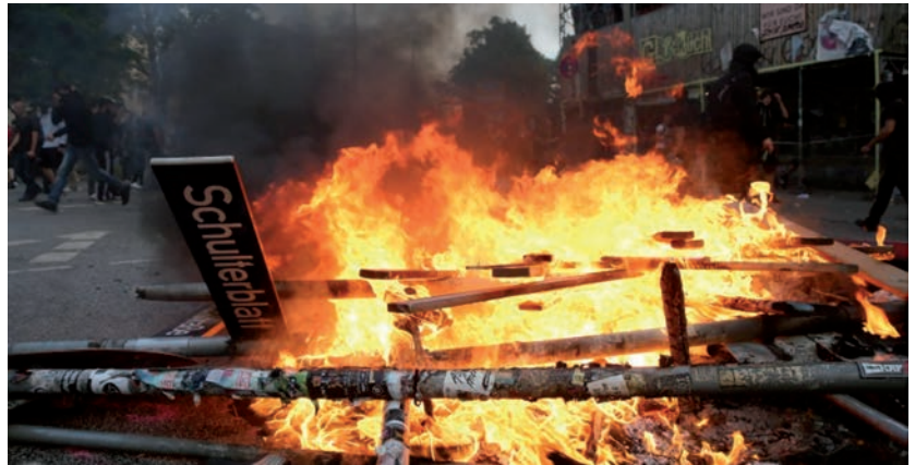
Brennende Barrikade im Schanzenviertel

Anders als der SPIEGEL in seiner knappen Zitatmontage wohl intendiert hat, ist der Fall also keineswegs so eindeutig, sondern linguistisch verzwickelt. Zur Klärung der Frage, ob die beiden Zitate widersprüchlich oder miteinander verträglich sind, sollen hier Bedeutung und Verwendungsweise der superlativischen Vergleichskonstruktion und der Konstruktionen mit den Rangfolgeausdrücken Priorität und (nicht) nachrangig sein analysiert werden, um schließlich die semantische Komposition dieser Bestandteile des Zitats herauszuarbeiten.