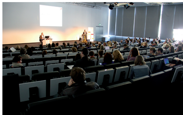
IDS-Jahrestagung im Rosengarten

senschaftlerinnen und Sprachwissenschaftler aus 25 Ländern vom 10. bis 12. März 2015 auf der 51. Jahrestagung des IDS im Rosengarten Mannheim überzeugen. Das diesjährige Thema lockte mit 15 Vorträgen rund um „Sprachliche und kommunikative Praktiken“. Aus verschiedenen Blickwinkeln wurden ‚Praktiken‘ beleuchtet, und über den Zusammenhang vor allem von Sprache und ihrem jeweiligen leiblich-körperlichen Vollzug im gesellschaftlichen Kontext diskutiert.