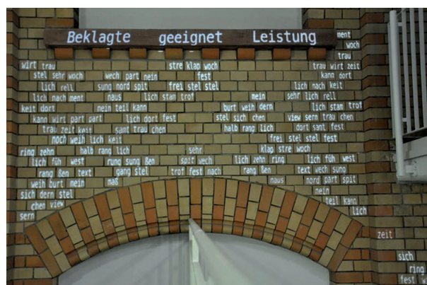
Installation von Jaime Ramirez