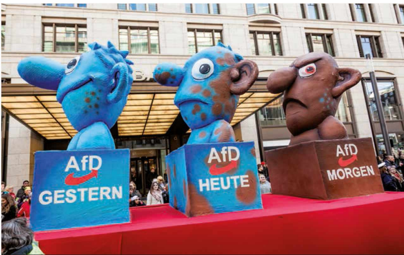
Wagen beim Karneval in Düsseldorf, 13. März 2016

Mit dem Wort völkisch wird zudem ausgedrückt, dass Migranten, die jetzt nach Mitteleuropa kommen,