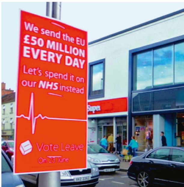
Plakat der Brexit-Kampagne aus dem Jahr 2016