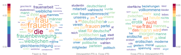
Abb. 2: Wortwolken für die typischen Wörter des Themenbereichs Frauen im Vergleich mit dem restlichen Korpus (links) und in den Textsorten Zeitungsartikel vs. Essay im Themenbereich Frauen (mitte und rechts).

Abbildung 2 zeigt den Beitrag einzelner Wörter zu der Distanz zwischen Teilkorpora in Form von Wortwolken. Groß dargestellte Wörter sind hierbei besonders typisch für ein Teilkorpus, die Farbe korrespondiert mit der relativen Häufigkeit eines Wortes im Teilkorpus (blau für selten, purpur für häufig). Die Wortwolke links vergleicht Frauen mit dem restlichen Korpus. Sie wird sowohl auf begrifflicher Ebene ( Frau/Mann ) als auch auf grammatischer Ebene ( die, ihre, sie, ... ) vom allgemeinen Diskursgegenstand Frauen dominiert. Die Wortwolke in der Mitte zeigt die typischen Wörter von Zeitungsartikeln im Vergleich zu Essays innerhalb des Themenbereichs Frauen , die Wortwolke rechts typische Wörter im umgekehrten Vergleich. Hier wird deutlich, dass Zeitungsartikel sich im wesentlichen um die politisch/öffentliche Stellung der Frau drehen ( Wahlrecht, Frauenstimmrecht, politische ) und Essays um die private Welt der Frau ( Beziehung, Moral, Erotik ). Ein sehr deutlicher Unterschied zeigt sich auch im Numerus von Frau : Plural in Zeitungsartikeln und Singular in Essays .