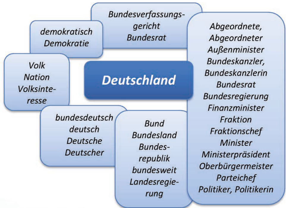
Abb. 1: Entwurf für den Zugriff auf thematische Gruppen bearbeiteter lexiko -Stichwörter

gisch geordnet sein, und dynamische Visualisierungen von Lexemzusammenhängen sind im Printmedium ausgeschlossen. Eine Aufbrechung des semasiologischen Zugriffs gelingt im Printwörterbuch nur durch die Integration sogenannter Kästchenartikel, in denen z. B. eine Gruppe rechtschreiblich schwieriger Wörter oder eine Reihe von Stichwörtern einer bestimmten grammatischen Kategorie (wie die Modalverben, die Personalpronomina etc.) beschrieben wird. Bildtafeln, die z. B. ein Wortfeld wie die Bezeichnungen für Laubbäume illustrieren, können eine ähnliche Funktion haben. Im Typ des Wörterbuches sprachlicher Zweifelsfälle werden außerdem teilweise zwei oder mehr Lexeme