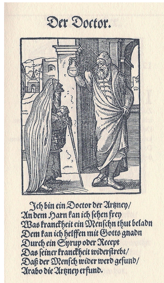
Abb. 1: Der Doctor. In Sachs (1568), S. 29

dem frühneuzeitlichen Ständebuch (Sachs 1568, S. 29), in dem den Arabern sogar die Erfindung der Heilkunst zugestanden wird. Syrup/Sirup ist ein Arabismus.