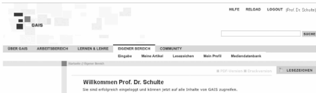
Abb. 2: Das GAIS-Hauptmenü mit der Begrüßung für registrierte Benutzer

Das online verfügbare GAIS-Angebot umfasst Korpora, Arbeitsinstrumente, Ergebnisse und Möglichkeiten zur Kommunikation zwischen den Benutzern. Es ist offen für theoretische und methodologische Entwicklungen, neue Analysegegenstände sowie neue Materialangebote. Um das System für weitere Autoren nutzbar zu machen, ist es jetzt auf ein Content-Management-System mit neuem Layout und neuer Benutzerverwaltung umgestellt worden.