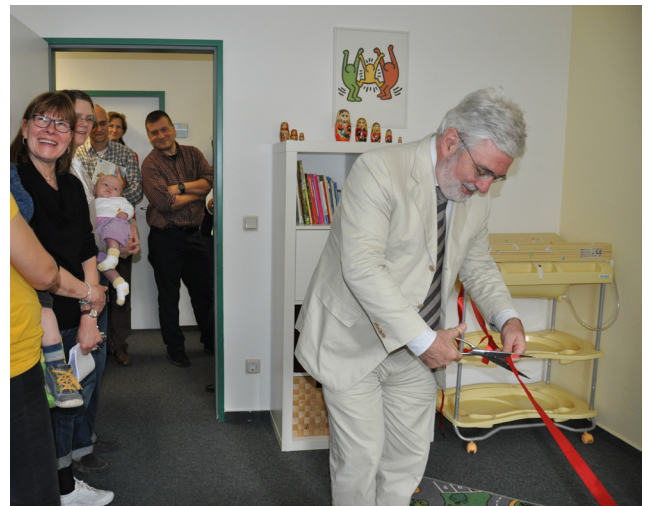
Einweihung des Eltern-Kind-Zimmers

Das Eltern-Kind-Zimmer (EKIZI) des IDS wurde am 2. Oktober offiziell eröffnet. Mit dem EKIZI wird im IDS beschäftigten Eltern ein Angebot gemacht, das sie bei der Wahrnehmung ihrer Familienverantwortung unterstützt. Hier sind Kinder aller Altersstufen herzlich willkommen – inmitten der Ar-