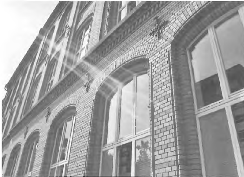
Institutsgebäude in Mannheim, R5, 6-13

Letztlich war – eine Art Symbol dafür mag sein, dass Jost Trier die Eröffnungsansprache bei der Gründungsversammlung des Instituts hielt – das Institut ein Ort, in dem auch die sprachwissenschaftlichen Traditionen des deutschen Strukturalismus der Zwanziger- und Dreißigerjahre ihre Fortsetzung fanden. So wurde denn mit der 1990 begonnenen und bis heute weitergeführten Arbeit am »Fremdwörterbuch« die typische Tradition »kultureller Wörterbücher« aus diesem Kontext in moderner Form fortgeführt.