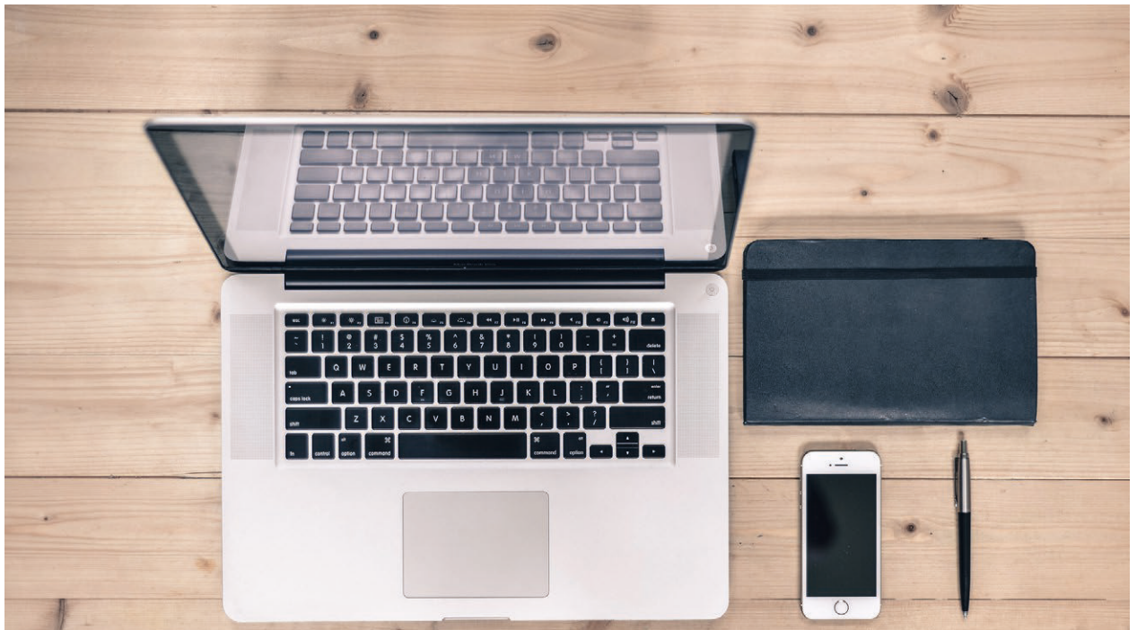
Abb.1: https://pixabay.com/photos/desk-laptop-computer-notebook-602975/ . ■