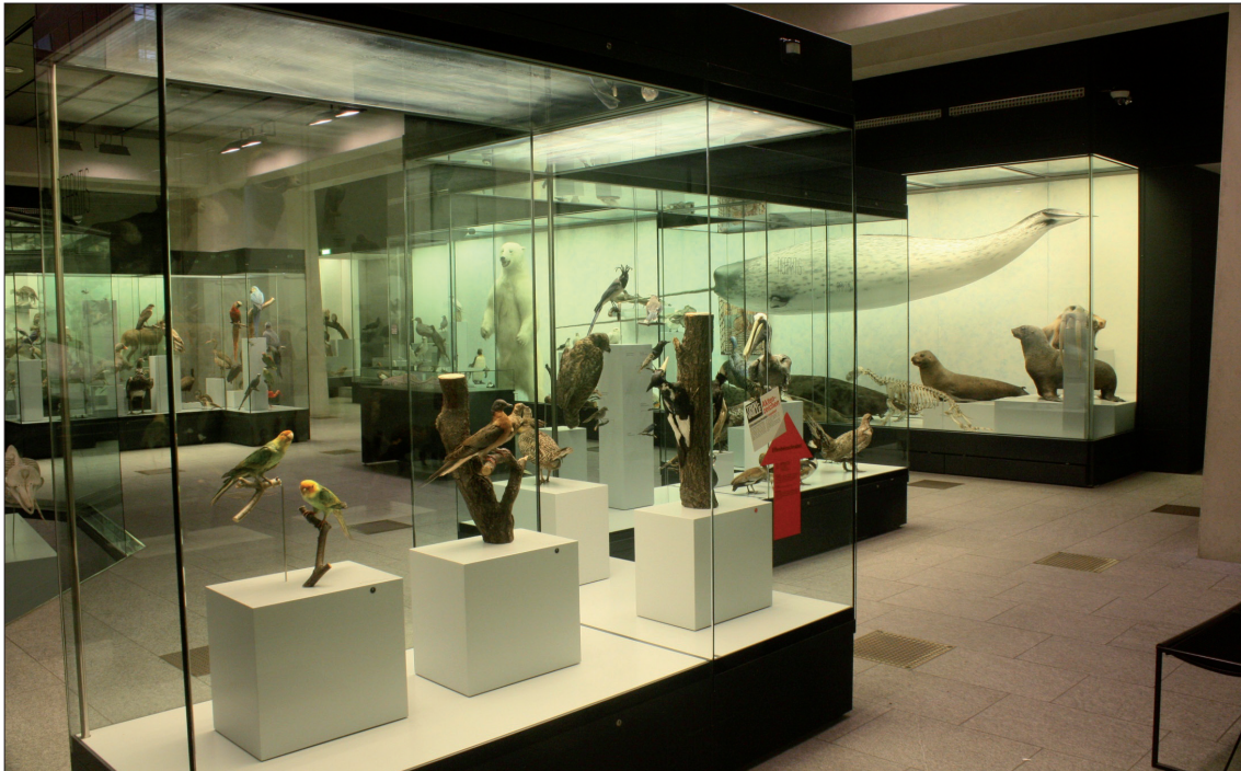
Abb. 9: Wohin gehen? Was anschauen? – Visuelle Vielfalt und Diffusität im Ausstellungsraum.

Formen im Vergleich zu Transkriptionen. Da wir architektonische Erscheinungsformen (›Räume‹) oft nicht nur in einer, sondern in unterschiedlicher Repräsentation vorliegen haben, stellt sich die Frage der autonomen Aussagefähigkeit der Repräsentanz-Formen und der Übertragbarkeit und additiven Anreicherung der interaktionsarchitektonischen Aussagen auf der Grundlage der Analyse von Standbild und Grundriss. Hier war z. B. die Erkenntnis instruktiv, dass bei der Analyse des Ausstellungsraums (Wolfgang Kesselheim) das Standbild (Abb. 9) den Aspekt der visuellen De-Fokussierung und Diffusität wachgerufen hat (Wohin gehen? Was anschauen?):