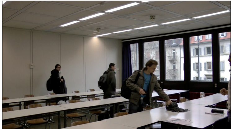
Abb. 16: Die Fragmentierung macht das Gesamtbild in neuer Weise aufschlussreich.

zentraler Elemente des sichtbaren Segmentes im Gesamtraum aufkam. Dadurch stellte sich die Frage nach der fragmentalen Repräsentanz der interaktionsarchitektonischen Gesamtstruktur. Der Ausschnitt nötigte uns darüber hinaus die Schwierigkeit auf, in einer analytisch gehaltvollen Weise und in einer erkenntnisadäquaten Begrifflichkeit uns durchaus gewohnte und vertraute Gegenstände wie Tische und Stühle zu verfremden und einen funktionale Purismus der ästhetischen Gestaltung gewissermaßen neu zu formulieren. Das machte auf besonders eindringliche Weise deutlich, dass Vorwissen an dieser Stelle ein durchaus hinderliches Gepäckstück sein kann. Weiterführender ist an dieser Stelle ohne Zweifel das methodisch motiviert «Sich-Dumm-Stellen», weil es dazu zwingt, das Wiedererkannte interaktionsarchitektonisch zu reformulieren (s. Kapitel 6).