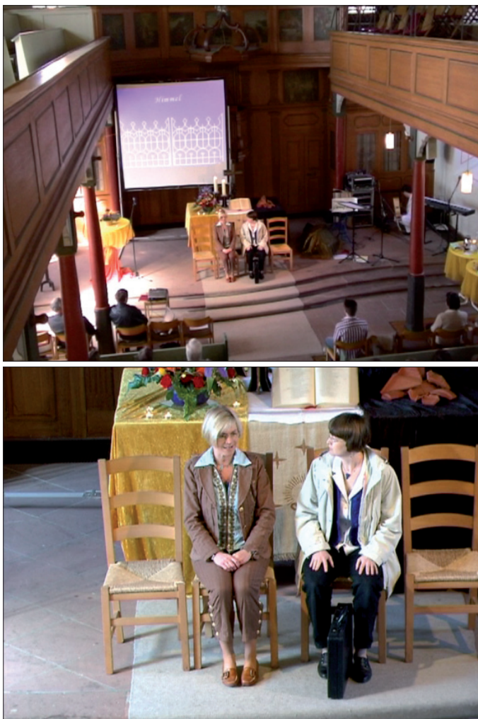
Abb. 23 & 24: Das interaktionsarchitektonische Versprechen der Stühle wird eingelöst.

Mit dem, was wir auf Abb. 23 & 24 sehen können, wird sofort ersichtlich, dass das, was hier auf den Stühlen passiert, unter der Bedingung der genauen Beobachtung des Publikums passiert, also in