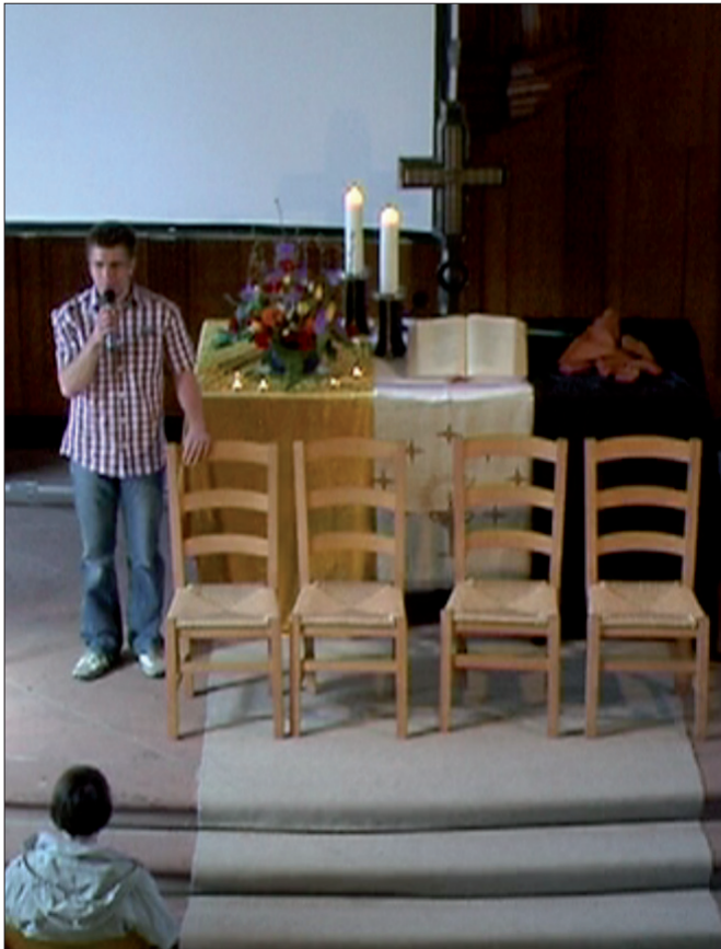
Abb. 1: Konkrete Interaktion folgt nicht immer den interaktionsarchitektonischen Implikationen

punkt natürlich die Interaktionsanalyse bleibt (s. Kapitel 3). Auch wenn sich z. B. zeigen lässt, dass in einer konkreten Interaktion eine im Raum qua Bestuhlung manifestierte Sitzordnung für diese Interaktion nicht von Relevanz ist (s.o.), gehört die Bestuhlung doch zu den architektonischen Erscheinungsformen, in denen sich Implikationen für das ausdrücken, was mit und durch Architektur im fraglichen Raum erwartbar gemacht worden ist und deshalb zwangsläufig auch interaktiv mit jeder denkbaren Nutzung irgendwie <bearbeitet> wird. Benötigt wird deshalb eine Dokumentation der architektonischen Erscheinungsformen, z. B. in Form einer Fotografie oder eines Standbildes, auf der bzw. auf dem die fragliche Bestuhlung sichtbar ist. Während wir in den Raum-als-interaktive-Ressource-Analysen architektonische Erscheinungsformen bislang nur dann einbezogen haben, wenn und in dem Masse, in dem sie auch tatsächlich ge- und benutzt worden sind, sollen diese Erscheinungsformen nun möglichst exhaustiv er-