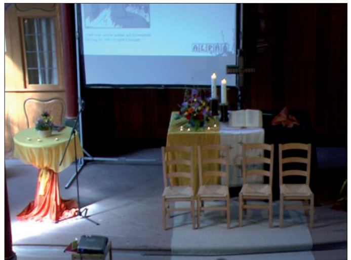
Abb. 19 & 20: Bistrotisch, Leinwand und Stühle modifizieren die sozialtopografischen Benutzbarkeitshinweise des Altarraumes.