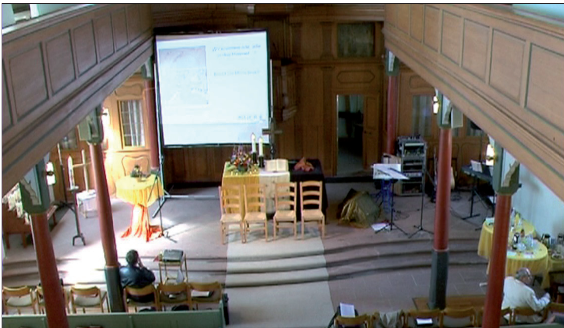
Abb. 2: Die Kameraperspektive richtet sich nach den interaktionsarchitektonischen und sozialtopografischen Implikationen.

Die Komplexität und analytische Fruchtbarkeit der einzelnen Kategorien kann man sich gut am Beispiel von Sichtbarkeit klar machen. Wer oder was wird durch den Raum sichtbar gemacht? Schon in einer solchen Frage stecken sehr weitgehenden Strukturimplikationen; denn nur unter spezifischen Bedingungen ist ein Aspekt im Raum z. B. perspektivenunabhängig sichtbar. Perspektive und Perspektivität sind also für Interaktionsarchitektur relevante Konzeptimplikation von Sichtbarkeit. Eine weitergehende Frage könnte dann beispielsweise lauten: Lassen sich prototypische, in den architektonischen Erscheinungsformen manifeste Perspektivitätsstrukturen finden und zur interaktionsräumlichen Typisierung nutzen? Hierhin gehören offensichtlich Unterscheidungen wie die zwischen hinten und vorne , unten und oben , aber auch die von innen und aussen (s.u.), die auf eine Art Relevanzstruktur von Sichtbarkeit als Wahrnehmungsangebot verweisen. So bildet das folgende Standbild vom Kirchenraum (Abb. 2), auf das wir in der Fallanalyse noch ausführlicher zurückkommen werden, in heuristisch fruchtbarer Weise eine im Gegenstandsbereich selbst erzeugte Relevanzstruktur von Sichtbarkeit ab: