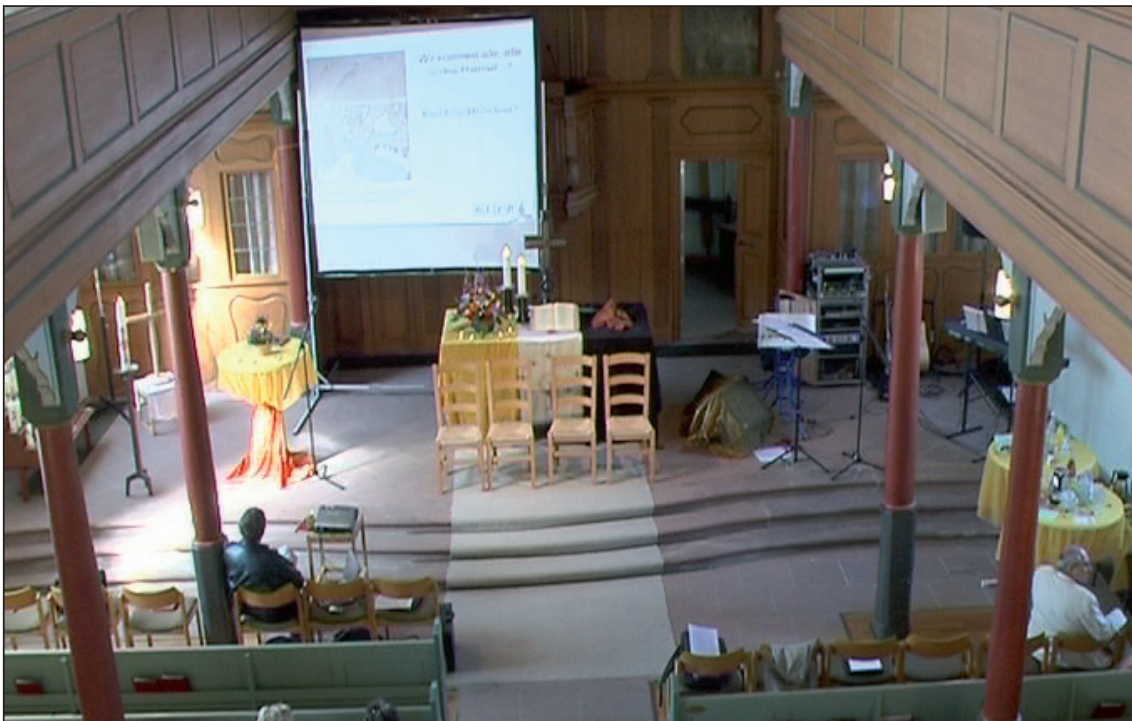
Abb. 18: Die mittlere Zoomeinstellung der Kamera schneidet den Bereich der Kirchenbänke nach mehreren Seiten ab.

Das Standbild (Abb. 18) zeigt den Altarraum und die ersten Sitzbänke und Stuhlreihe einer Kirche aus der Perspektive der Kamera, die auf der Empore platziert ist. Auf die Wissensabhängigkeit dieser Beschreibung kommen wir noch zurück (s.u.). Die Aufnahme ist zudem charakterisiert durch eine mittlere Zoomeinstellung, die z. B. den Bereich der Kirchenbänke nach mehreren Seiten «abschneidet».