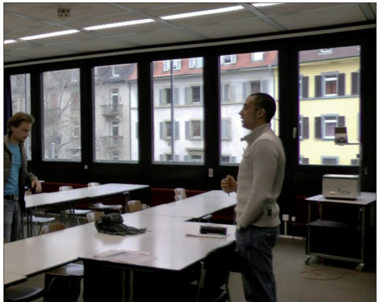
Abb. 3: Die Raumarchitektur kann mit Fenstern Aspekte von «Aussenwelt» sichtbar machen, die für die Innenwelt kontingent sind.

Es können mit einem Fenster aber auch Aspekte weiterer Innenräumlichkeit und «Verschachtelung» zugänglich gemacht werden, die für das, was im «Kern» passiert, sehr wohl von grosser Bedeutung sein können (wie im Ton- und Aufnahmestudio). Schliesslich wäre, was Transparenz betrifft, auch an die «Vitrinen» im Ausstellungsraum zu denken, die noch einmal neue interaktionsarchitektonische Implikationen von Sichtbarkeit in