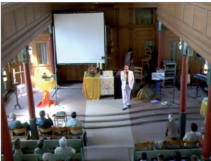
Abb. 25 & 26: Durch das Wegräumen der Stühle wird der Altar ‹freigeschaltet›.