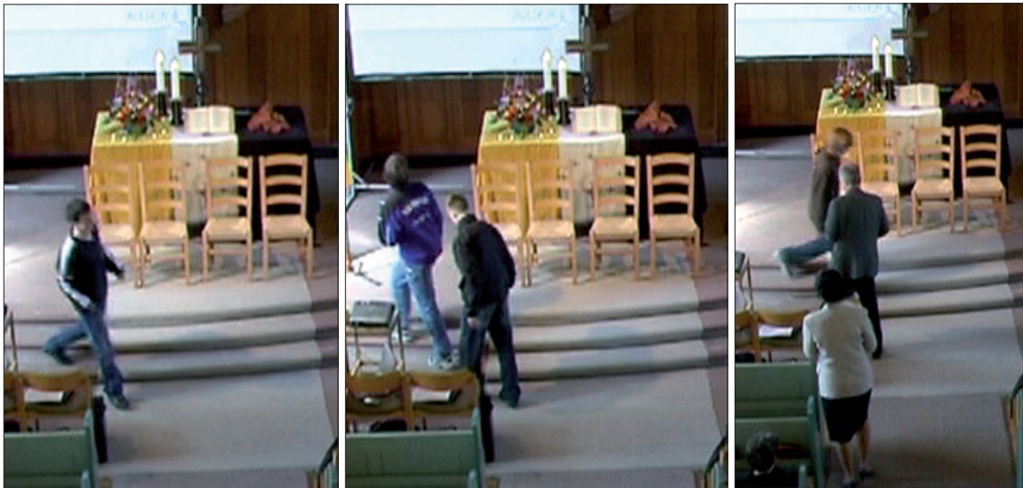
Abb. 6–8: Gottesdienstbesucher vermeiden systematisch das Betreten des Teppichs im Bereich der Altarstufen – ausser es droht eine Kollision.

Der Teppich wird in diesem Bereich nur betreten, wenn situationspezifische Ausnahmen – wie beispielsweise «dichter Gegenverkehr», in dem eine Kollision mit dem Pfarrer droht – den Konfirmanden keine andere Wahl lassen (Abb. 8).