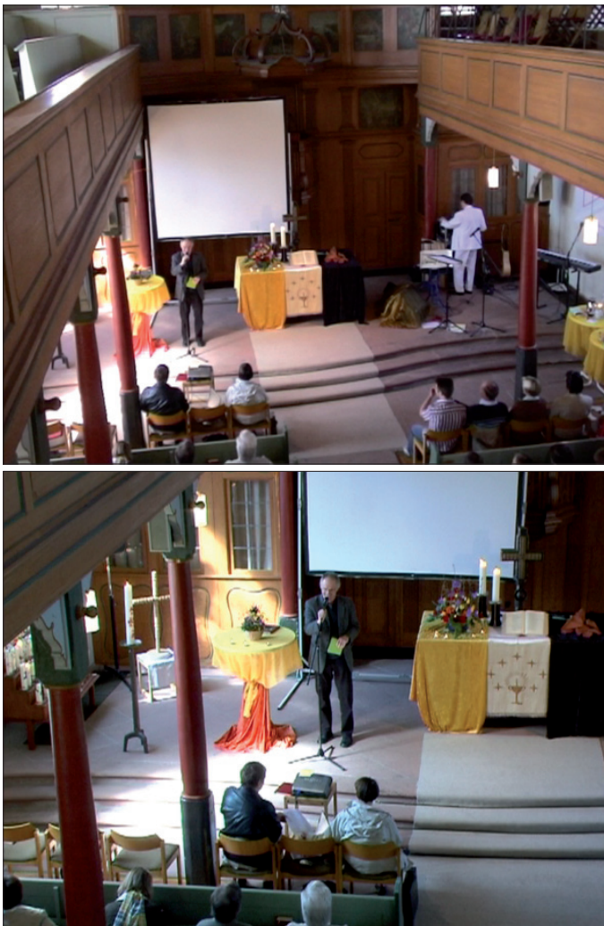
Abb. 27 & 28: Der Sprecher wählt durch seine Positionierung den Altar zugunsten des Bistrotisches ab.

Wir sehen nun, dass das interaktionsarchitektonische Versprechen des Stehtisches eingelöst wird. Im Unterschied zu dem ersten Sprecher hat sich nun ein zweiter Sprecher an der durch Mikrofon und den Mikrofonständer vorgesehenen Stelle positioniert und den Gottesdienstbesuchern zugewandt. Auch wenn wir die Nutzbarkeitshinweise des Stehtisches bislang nicht entwickelt haben, fällt mindestens die relative Nähe des aktuellen Sprechers zum Stehtisch als Bezugspunkt auf. Er nimmt, wenn man so will, die Positionierung des Mikrofonständers in der Nähe des Tisches auf, um sich ebenfalls neben diesen zu stellen, so dass die in Reichweite befindliche Tischoberfläche als Ablage- und Manipulierfläche nutzbar gemacht werden könnte. Es bleibt, anders als bei einem Lesepult, ein Rest an nicht eingelöster Benutzbarkeit (auf den Ausdrücke wie «Bistrotisch» verweisen, ohne dass wir das hier vertiefen wollen). Wichtiger ist, dass auch in diesem Fall die Position vor dem Altar leer bleibt. Die Sozialtopografie des Altarraumes wird