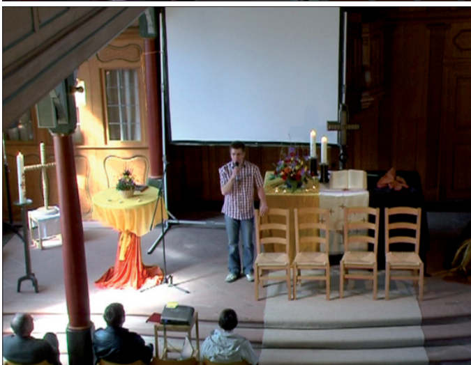
Abb. 21 & 22: Abstützen statt setzen – Kontingente vs. auferlegte Benutzbarkeitsrelevanz der Stühle.