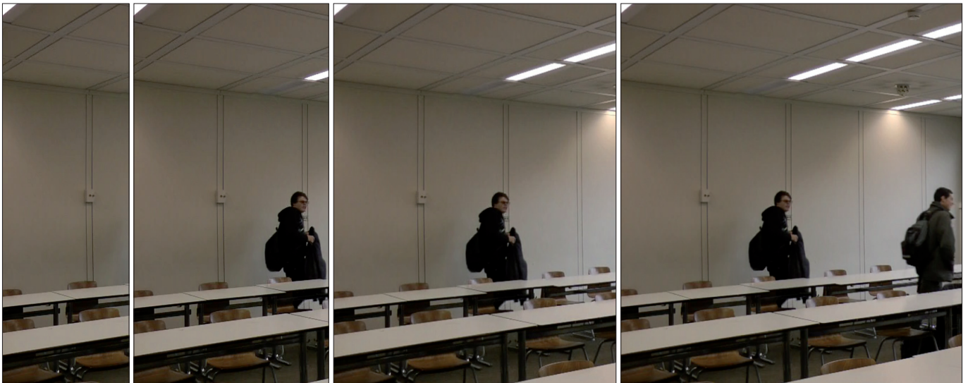
Abb. 10–13: Die segmentale Einzelbildanalyse macht das interaktionsarchitektonische Angebot in fragmentierter Weise sichtbar...

Bei der segmentalen Einzelbildanalyse haben wir uns in motivierten Segmenten und in einer durch das Dokument selbst nahegelegten Weise von links nach rechts schrittweise einen Gesamtüberblick über das interaktionsarchitektonische Potenzial eines Raumes (Klassenraum) erarbeitet. Das konkrete Vorgehen war dadurch bestimmt, dass wir (Dausendschön-Gay und Schmitt) ein Anfangssegment (Abb. 10) definiert haben, das nur unbelebten Raum zeigt. Hier war also die Vermeidung der Sichtbarkeit von Anwesenden im Standbild die letztlich segmentstiftende Erstorientierung. Von diesem Segment aus haben wir den Analyseausschnitt des Standbildes dann systematisch und wieder stark an Personen im Raum orientiert erweitert.