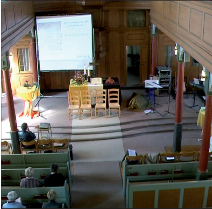
Abb. 17: Die vier Stühle im Kirchenraum sind unübersehbar: Ihre analytische Relevanz ist auferlegt.

aspektualisierten Bildanalyse: Es geht nicht um die isolierte Betrachtung des ausgewählten Aspektes, sondern um dessen Status als Teil des interaktionsräumlichen Gesamtbildes. Das bedeutet, dass die aspektuelle analytische Rekonstruktion immer auch eine Beantwortung der Frage nach der Relevanz des Aspektes für das Gesamtbild beinhalten muss. Wir kommen darauf in der Fallanalyse ausführlich zurück (s. Kapitel 8).