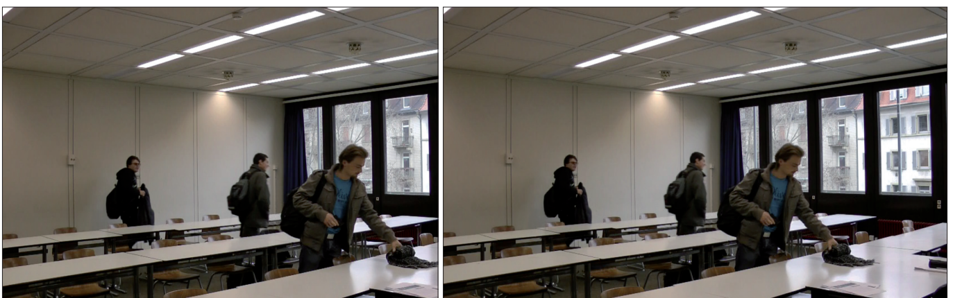
Abb. 14&15: ...und zwingt dazu, sich auf das jeweils Sichtbare zu konzentrieren.

Segment 2 (Abb. 11) zeigte die erste Person, Segment 3 (Abb. 12) den Abstand bis zur zweiten Person, Segment 4 (Abb. 13) die zweite Person, Segment 5 (Abb. 14) den Bereich bis zur dritten Person, Segment 6 (Abb. 15) die dritte Person und Segment 7 (Abb. 16)