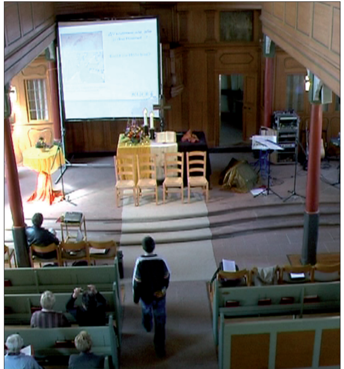
Abb. 5: Die Begebarkeit des Mittelganges im Kirchenraum erschliesst sich ohne raumkognitives Spezialwissen.

Eine weitergehende interaktionsarchitektonische Analyse hört, was die Begebarkeit betrifft, beim Mittelgang nicht auf. Der Mittelgang führt nicht nur zu den seitlich abzweigenden Bankreihen, sondern auch in den Bereich vor den Bankreihen, der zudem durch Treppenstufen interaktionsarchitektonisch in seiner Begebarkeit speziell hervorgehoben ist und offensichtlich weitere Verweilstationen enthält. Kirchenbesucher wissen nun aber auf der Grundlage ihrer sozialtopografischen Kompetenz, dass diese interaktionsarchitektonisch nahegelegte Nutzung dieser durchaus begehbaren Fläche des Kirchenraums de facto begrenzt und reserviert ist. So «darf» etwa der Altarraum im Gegensatz zum Mittelgang von den Besuchern nur zu ganz speziellen Anlässen betreten werden (Abendmahl, Taufe, Hochzeit etc.). Normalerweise ist er jedoch für den Pfarrer/die Pfarrerin und den Lektor/die Lektorin reserviert, wobei auch letztere nicht fraglos Zugang zum zentralen Bereich direkt vor dem Altar haben. Auch wenn der Altarraum von bestimmten Gottesdienstbesuchern betreten werden muss, was beispielsweise bei den sogenannten Kerzengängen von Konfirmanden (Schmitt 2012a, Schmitt 2012b, Schmitt i.Dr.a) der Fall ist, bestimmt deren sozialtopografisches Wissen um die binnensegmentale Struktur der begehbaren Bereiche (hier: Altarraum) ihre konkreten Laufwege. So