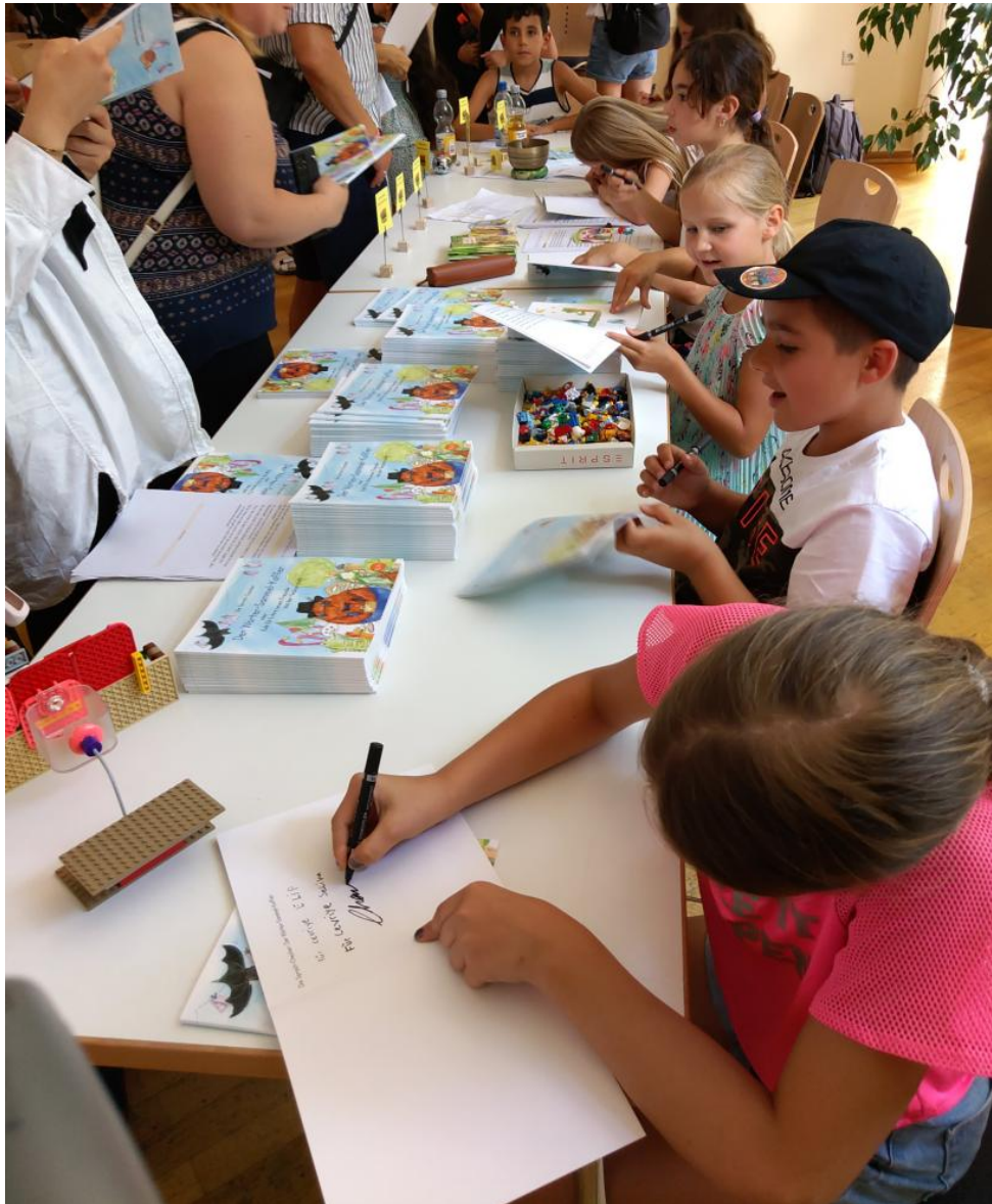
Großer Ansturm auf dem Sprachsommerfest: Die jungen Sprach-Checker signieren ihr Buch.

Die Ergebnisse der genannten bürgerwissenschaftlichen Aktionen wurden beim Sprachsommerfest im Bürgerhaus in der Mannheimer Neckarstadt-West präsentiert. Dabei feierten alle zusammen den Abschluss dieser Teilprojekte: die Sprach-Checker mit ihren Familien und Freunden als auch das IDS und alle stadtteilbezogenen Kooperationspartner – der Campus Neckarstadt-West , die Alte Feuerwache Mannheim , der Verein Neckarstadt Kids e.V. und die Marie-Curie-Realschule . Am Tag des Fests konnten die Besucher*innen vertiefende Einblicke in die vergangene Projektarbeit erlangen.